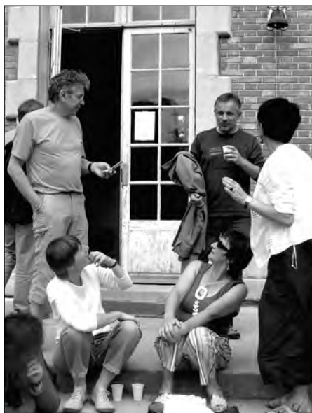
Mais qu'est-ce qu'elles regardent ?

Pourquoi ne pas essayer de faire serpenter les idées, pour les structurer et les renforcer au fur et à mesure, en circulant, d'un « atelier à l'autre », entre les écoles, collèges, lycées ou établissements proches, mutualiser nos expériences, comme ils l'avaient fait dans l'usine Lip, en notant leurs difficultés dans des carnets, pour rompre avec la culture du « garder pour soi », et en profiter pour aborder les questions parfois « terre à terre » dont on n'osera pas faire état dans les instances formelles, ou lors d'assemblées trop... générales ? Ca pourrait